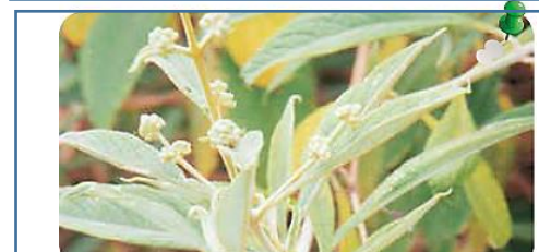
Matico: sirve para curar heridas.

4. ¿Qué otras hierbas medicinales conoces?