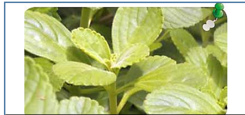
Boldo: se utiliza para aliviar dolores musculares e inflamaciones.