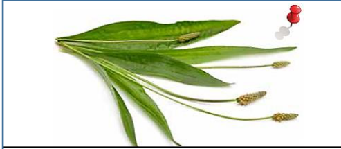
Llantén: sirve para tratar la gastritis y la diarrea.

Los pueblos originarios utilizaron diferentes tipos de hierbas medicinales para sanar a sus enfermos. Muchas de ellas siguen creciendo en Chile y son usadas de la misma manera que en el pasado. Se pueden usar en infusiones y cosmética. A continuación, te presentamos algunas de estas hierbas y el uso que se les da.