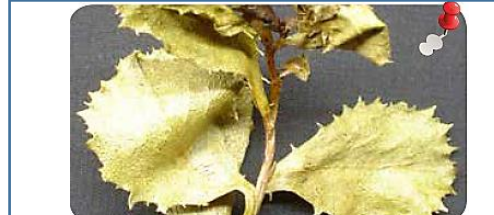
Bailahuén: se usa para tratar cólicos y enfermedades de las vías urinarias.