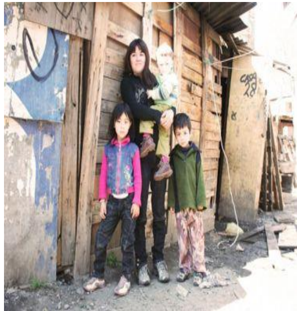
Familia año 2000