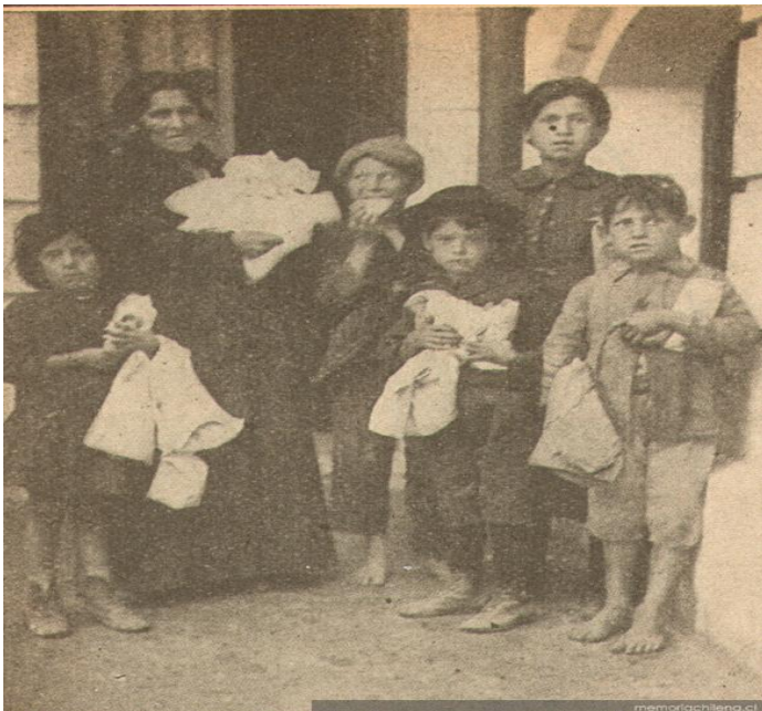
Pobres en Valparaíso 1919