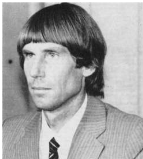
El Ministro de Hacienda Hernán Büchi, 1985

La recesión de 1982 va a ser finalmente superada en lo económico hacia 1985, la expansión económica se prolongó hasta la década del 90, dando lugar al denominado "Milagro Chileno". En ello destaca el protagonismo de un nuevo equipo económico liderado por Hernán Büchi , menos ortodoxo y más pragmático, de hecho un economista con estudios en Columbia y no en Chicago. Las redes comerciales de Chile se siguen extendiendo y su base económica se profundiza.