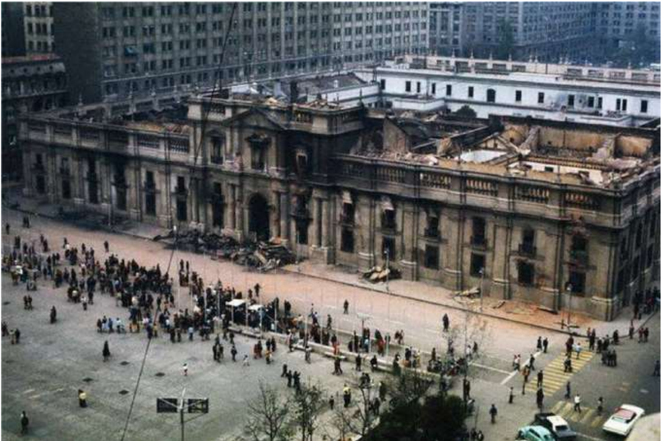
La Moneda tras el bombardeo del 11 de septiembre de 1973

La mayoría de estos regímenes militares presentaron características comunes, derivadas de su adscripción a similares corrientes ideológicas, que pretendían suprimir aquellas reformas que habrían llevado, según ellos, al caos interno, para lo cual era necesario eliminar cualquier tipo de oposición. Entre estas características encontramos la supresión del Estado de Derecho , prohibición de los partidos políticos y de cualquier forma de participación democrática, utilización de la censura a los medios de comunicación, uso de la violencia política y violación sistemática de los Derechos Humanos .