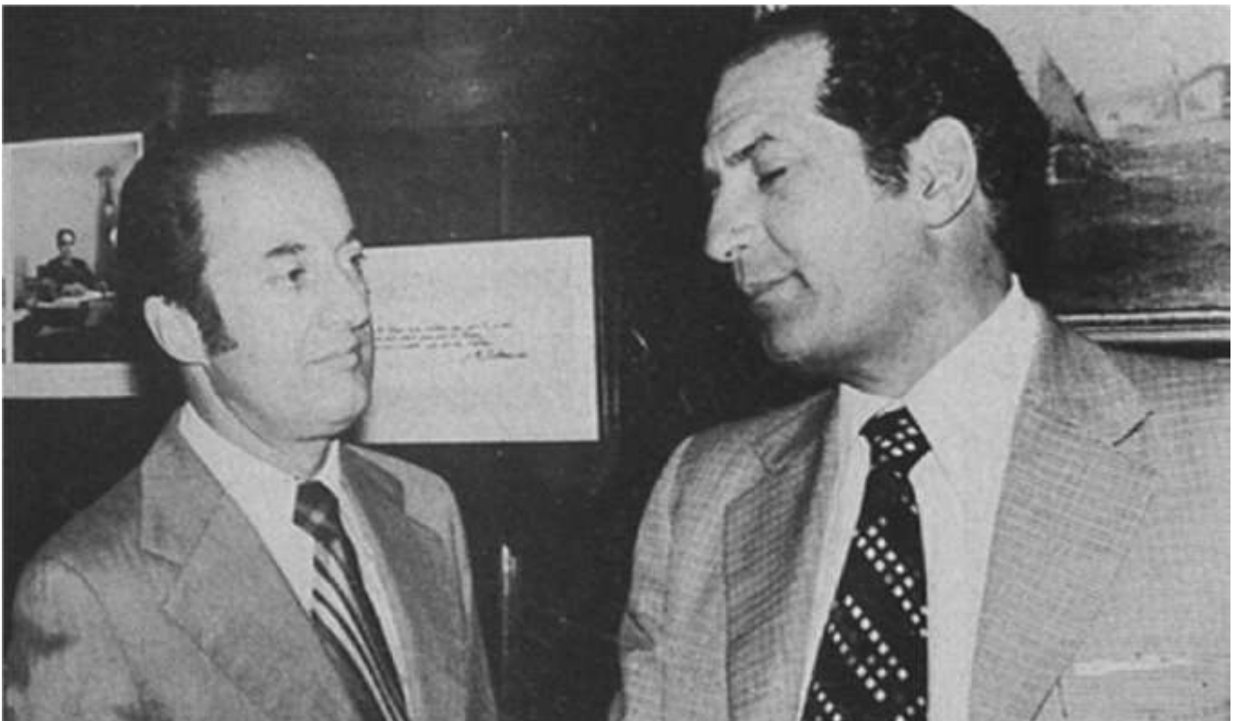
Los economistas Sergio de Castro y Pablo Barahona, 1982

El mercado del trabajo se desregularizó y flexibilizó en consonancia con la adopción de una economía de mercado. Se reformó la legislación laboral, flexibilizando las leyes laborales en lo referente a los derechos de negociación colectiva y huelga, los procedimientos para indemnización y despido y, especialmente, la normativa de sindicación, que pasó a establecer la afiliación voluntaria, lo que terminó por disminuir notoriamente toda capacidad de presión de los trabajadores frente al empleador. El Estado se limitó solo a la regulación del salario mínimo.