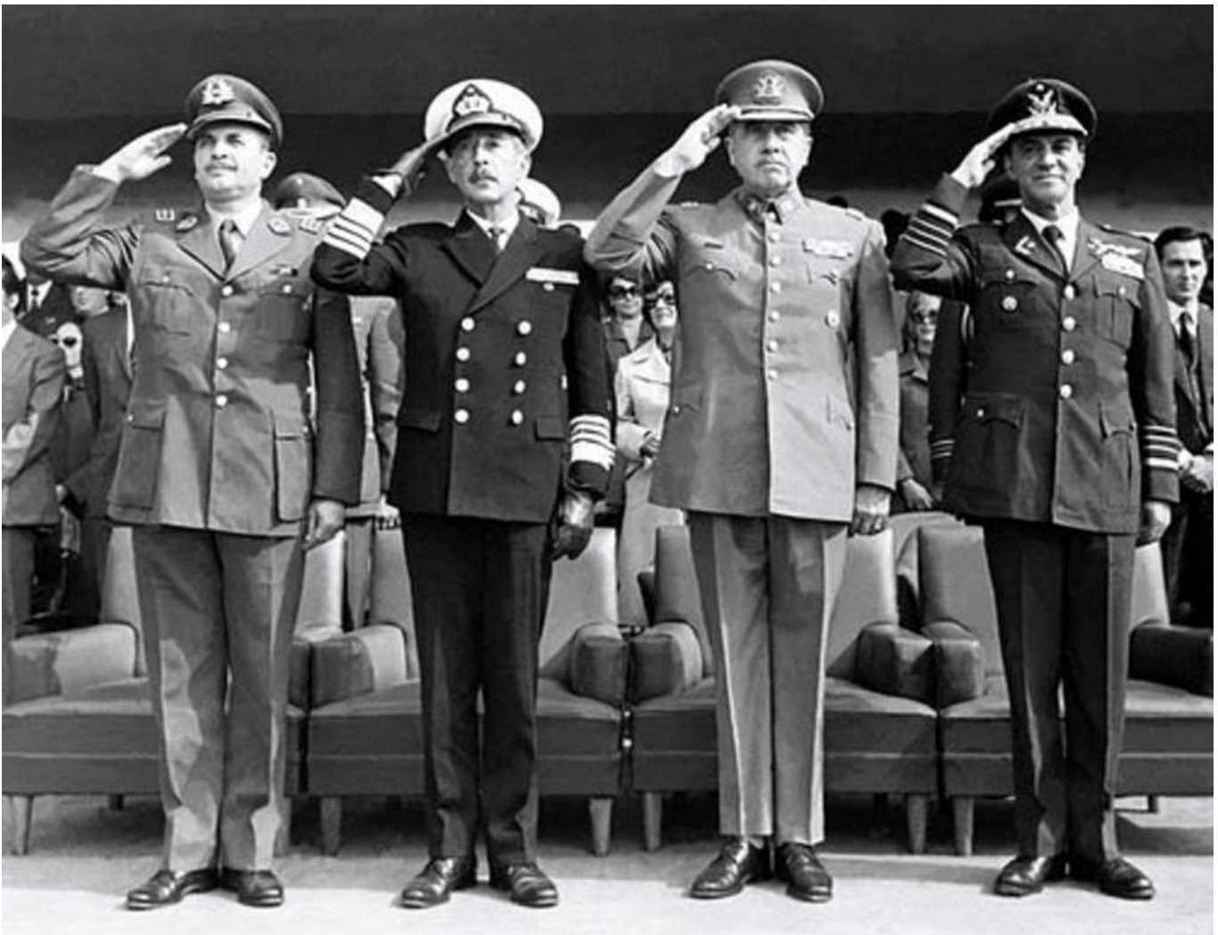
Junta de Gobierno. De izquierda a derecha: César Mendoza, director general de Carabineros; José Toribio Merino, comandante en jefe de la Armada; Augusto Pinochet, comandante en jefe del Ejército y Gustavo Leigh Guzmán, comandante en jefe de la Fuerza Aérea.

Durante el mismo 11 de septiembre, aviones y tanques bombardean La Moneda y el Presidente Allende se suicida en el lugar. A partir de ese momento los militares van a controlar toda la capital y el país. El gobierno se concentra en los tres comandantes en Jefe de las Fuerzas Armadas y en el General Director de Carabineros. En un principio la presidencia de la Junta sería rotativa, cosa que no se llevó a cabo, y en junio de 1974 el General Pinochet asumió el Poder Ejecutivo como Jefe Supremo de la Nación. El 17 de diciembre de 1974 fue nombrado Presidente de la República.