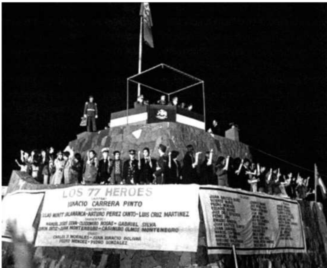
Discurso de Chacarillas (9 de julio, 1977)

El trabajo de la "Comisión Ortúzar" se vio cristalizado en la redacción de un nuevo Texto Constitucional, el que fue aprobado el 11 de septiembre de 1980 mediante plebiscito, en un contexto de múltiples anomalías electorales. Entre otras, se realizó sin la existencia de registros electorales, en un contexto de restricción severa a la prensa de oposición y con la aplastante deliberación política de las Fuerzas Armadas. Los resultados dieron el 67 % de aprobación, el 30 % de rechazo y el 3 % de votos nulos. Si bien su promulgación oficial se concretó el 21 de octubre del mismo año, la puesta en práctica en su integridad se postergó por casi 10 años.