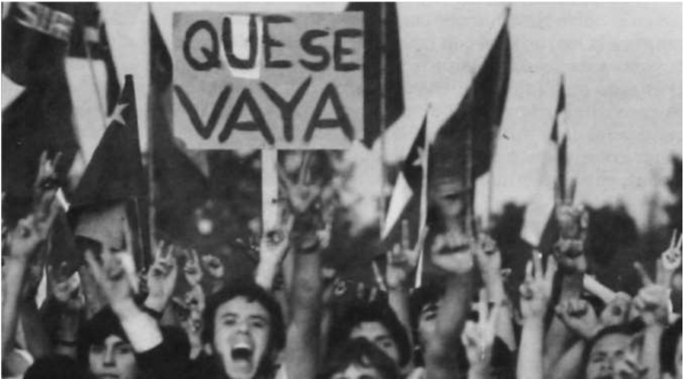
Concentración en Parque O'Higgins convocada por la Alianza Democrática, 18 de noviembre 1983

El Movimiento Democrático Popular se fundó como consecuencia de la exclusión del Partido Comunista de la Alianza Democrática. Estuvo integrado por este partido, el MIR y sectores del Partido Socialista (PS Almeyda). Si bien esta coalición coincidió con la Alianza Democrática en los objetivos, no estuvo de acuerdo con ella en los métodos para lograrlo. Los partidos del MDP defendían la tesis de la insurrección popular, no aceptaban negociaciones de ningún tipo con el régimen, y reconocían la legitimidad de "todas las formas de lucha", en alusión a la lucha armada desarrollada por el MIR desde 1980, y al surgimiento del Frente Patriótico Manuel Rodríguez , aparato militar del PC, fundado en diciembre de 1983.