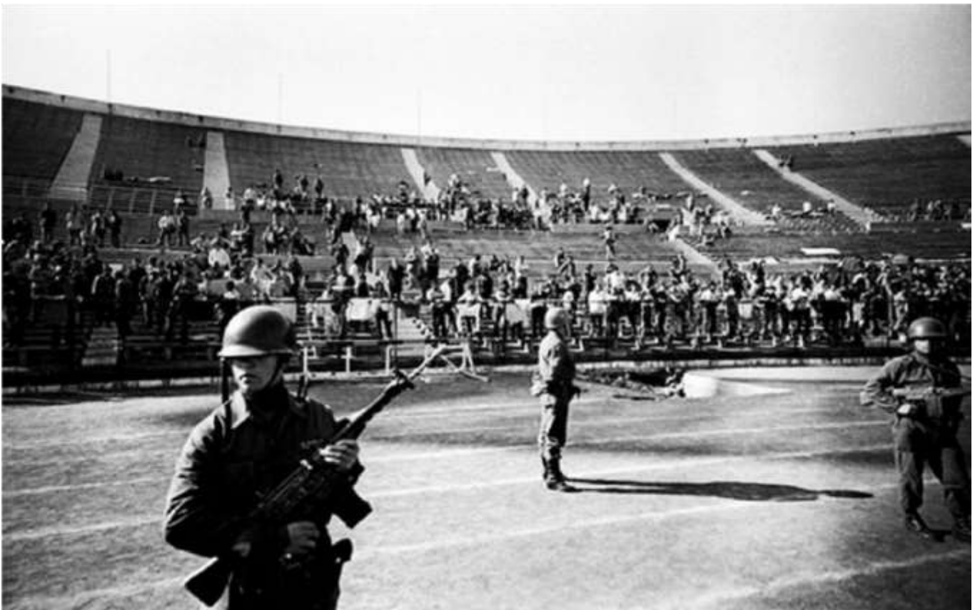
El Estadio Nacional fue utilizado como recinto de detención (septiembre, 1973)

Se restringen severamente las libertades fundamentales, como la libertad de desplazamiento, de prensa, de asociación, etc., a la vez que se detiene a los principales dirigentes políticos de izquierda en centros de detención ad hoc como el estadio Nacional, el estadio Chile, la Isla Dawson y Pisagua, entre otros. Se realizan allanamientos, enjuiciamientos, relegaciones, destierros y exilios.