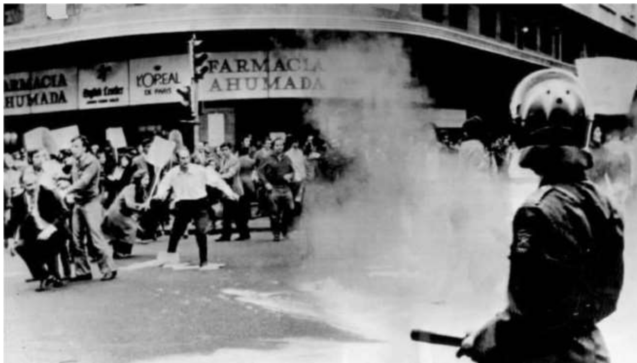
Disturbios en calle Ahumada, octubre de 1972.

En 1973 la situación sigue siendo crítica: la Iglesia Católica cuestiona el proyecto educativo de la ENU ( Escuela Nacional Unificada ), se producen manifestaciones callejeras diariamente, en contra y en apoyo al gobierno, atentados de torres de alta tensión, sabotajes en caminos y líneas férreas. El desabastecimiento, el mercado negro, las largas colas, provocan a las mujeres y éstas protestan haciendo sonar sus cacerolas.