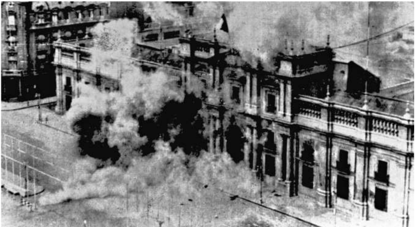
Golpe de Estado en Chile (11 de septiembre de 1973)

El movimiento opositor fue en aumento y algunos sectores llamaban abiertamente a la intervención de las fuerzas armadas, mientras se barajaba en el gobierno la posibilidad de llamar a un plebiscito para dar una salida política al conflicto. Esto no llegó a concretarse y se produjo el golpe del 11 de septiembre de 1973 que puso fin al gobierno de la Unidad Popular muriendo el Presidente Allende en la Moneda.