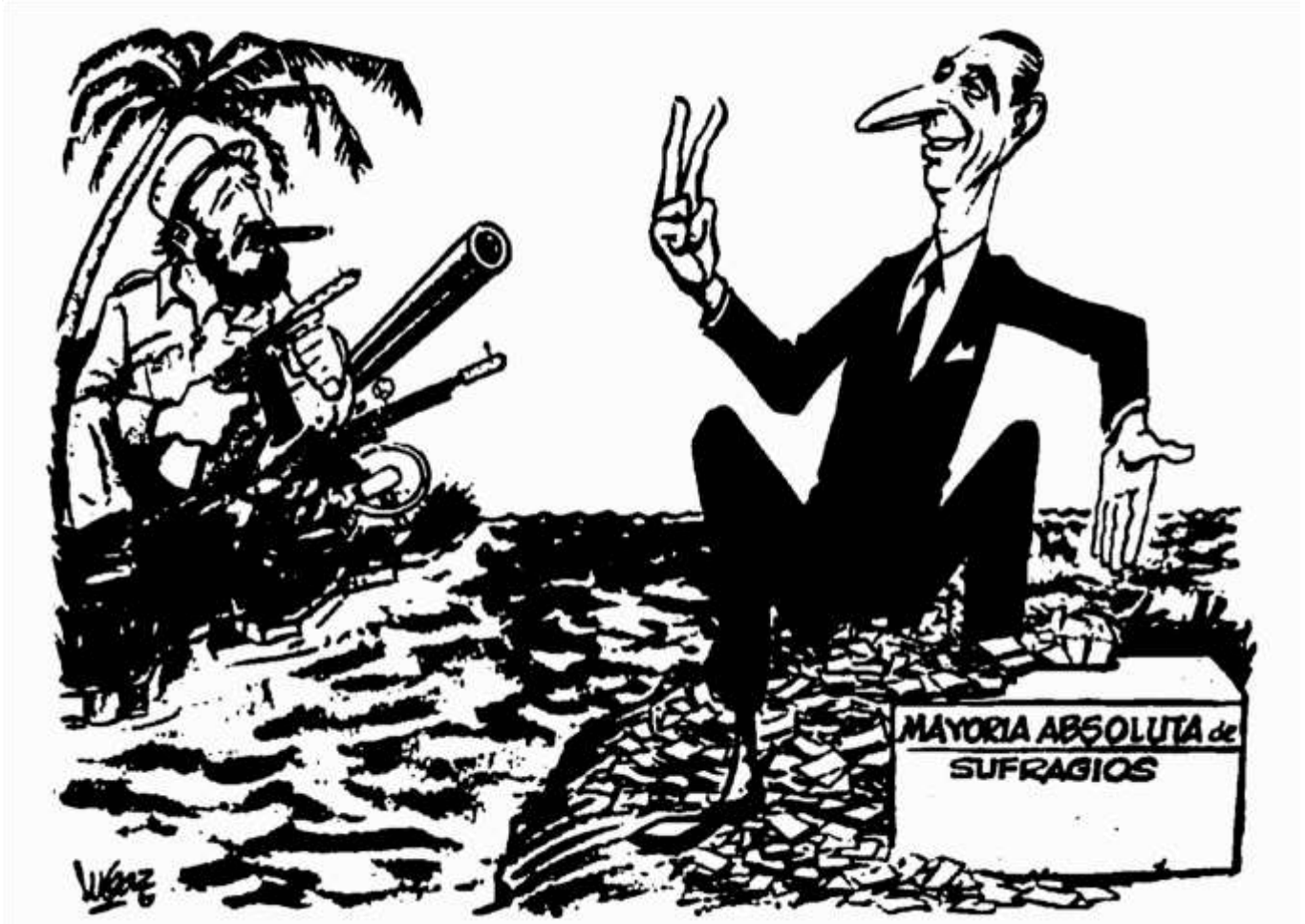
Frei: Ya ves, Fidel, que no necesité de armas para hacer una revolución en libertad. (Revista Topaze, 1964)

El gobierno de Estados Unidos intervino en la elección de 1964 para impedir el triunfo de la izquierda chilena, destinando grandes sumas de dinero a la campaña electoral de Frei Montalva, considerado como quien mejor podía alejar los fantasmas del comunismo. Finalmente, triunfó la candidatura de Eduardo Frei Montalva con un 56 % de los votos, frente a un 38,9 % de Salvador Allende y un 4,9 % de Julio Durán.