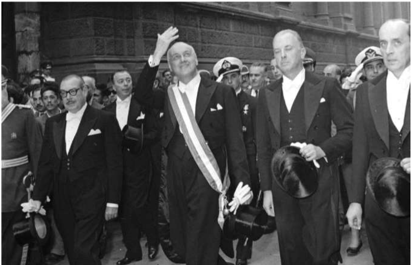
El triunfo de Alessandri en 1958 representó el regreso, por primera vez, de la derecha al poder ejecutivo, desde el segundo gobierno de su padre, Arturo Alessandri Palma (1932- 1938).