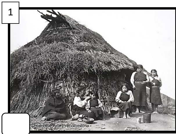
Familia mapuche frente a su ruca.

2. Observa las fotografías y realiza las actividades.