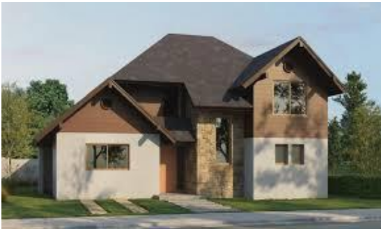
Casa moderna, de concreto