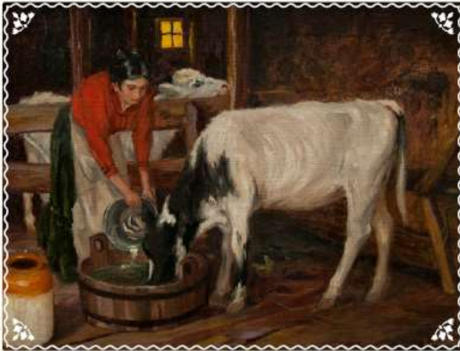
Establo y ternero por Enrique Lobos.