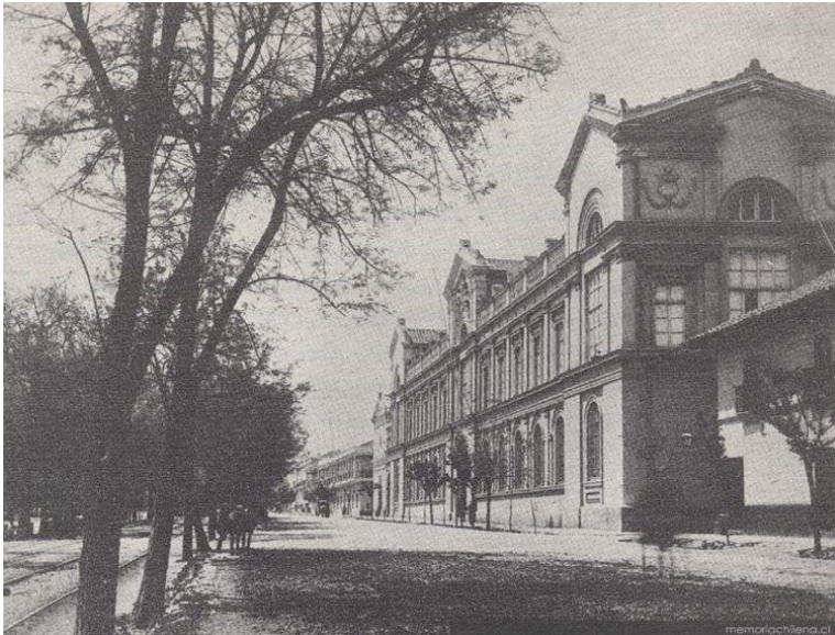
Universidad de Chile, 1880.

Hola, si tienes dudas o consultas sobre esta Guía escíbeme tatibaltierra@gmail.cl