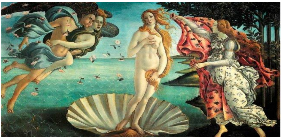
“El nacimiento de Venus” (Sandro Boticelli, circa 1484)